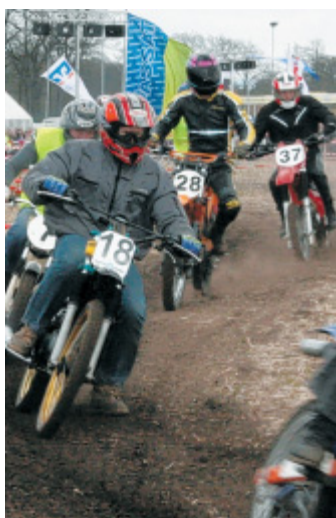
Mofa gegen Mofa: Aus Bielefeld, Delbrück und Sudhagen.