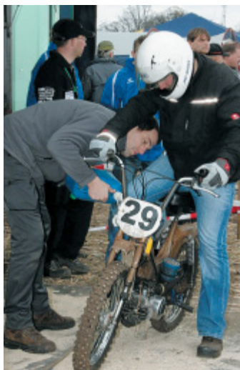
An der Tankstelle: Mit dem Black Rebel Mofacycle Club Ostentland.